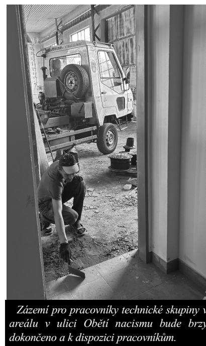
Zázemí pro pracovníky technické skupiny v areálu v ulici Obětí nacismu bude brzy dokončeno a k dispozici pracovníkům.