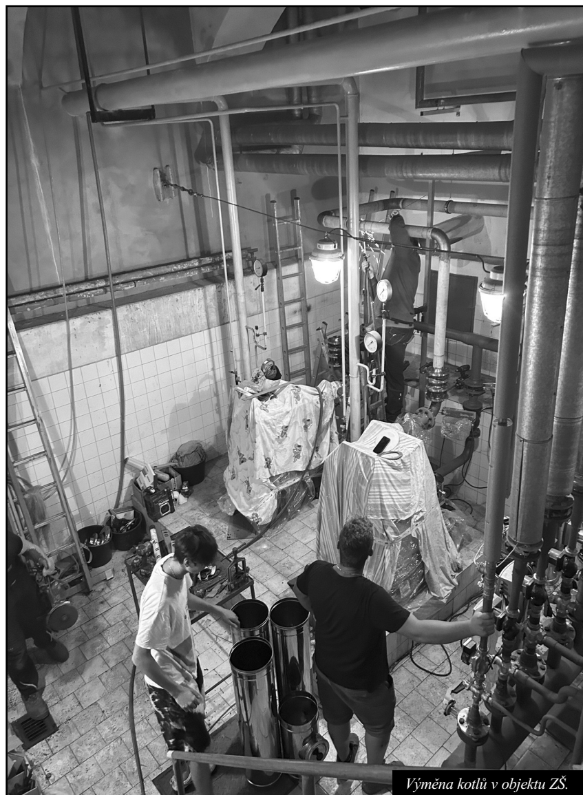
Výměna kotlů v objektu ZŠ.

Akutní lékařská péče bude poskytnuta v rámci lékařské pohotovosti v nemocnici v Táboře, a to ve všední dny v době 18-22 hod., v sobotu, neděli a o svátcích v době od 8 do 20 hodin. Neodkladná péče bude i nadále poskytována nepřetržitě na telefonní lince 155.