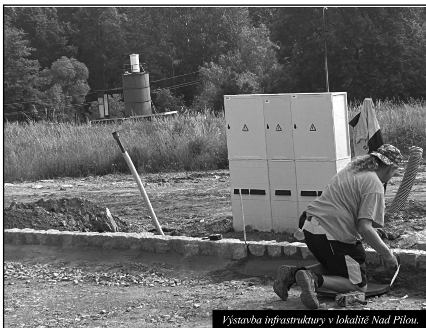
Výstavba infrastruktury v lokalitě Nad Pilou.

• Doporučila zastupitelstvu města schválit žádost Římskokatolické farnosti Mladá Vožice, poskytnutí finančního daru ve výši 100.000 Kč jako příspěvek k dotaci na akci – prostor pro setkávání – fara Mladá Vožice