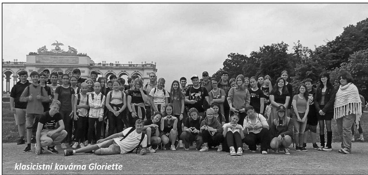
klasicistní kavárna Gloriette

Sotva jsme zamávali Vídni na rozloučenou, poznali jsme, že nic netrvá věčně. Za městem se rozbuňoval do kapoty našeho autobusu prudký déšť a ten nás provázel téměř k hranicím. Myslím, že se Vídeň všem líbila. Dle mínění průvodce jsme však mnoho památek neviděli. Kdo chce totiž dobře poznat Vídeň, nestačí mu na to jeden den, nýbrž potřebuje celý týden. Proto doufám, že se tam ještě někdy podíváme.