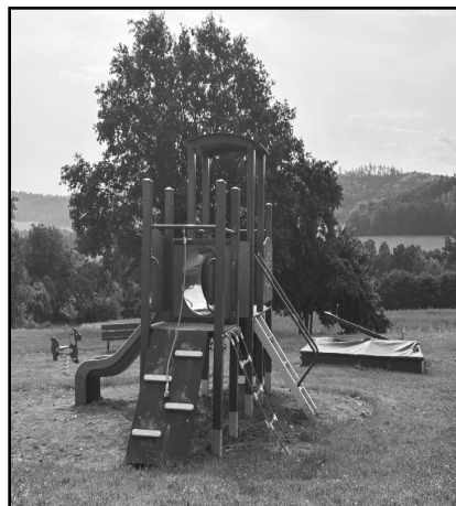
Dětské hřiště ve Sluneční ulici prošlo komplexní obměnou

Do těstovin, salátu nebo pomazánky je ovšem mnohem lepší použít čerstvý, kvalitní olej, a ten z konzervy vyhodit. Samozřejmě do správné popelnice na jedlý olej a tuk. Stejně nápadné je množství oleje použitého u nakládaného hermélínu či jiných sýrů s bylinkami, česnekem nebo chilli. Pokud nejste zvyklí použít tento bylinkový olej třeba pod maso – šup s ním do PET lahve a pak do popelnice na jedlý olej a tuk. U nás je popelnice na dvoře radnice nebo ve sběrném dvoře.